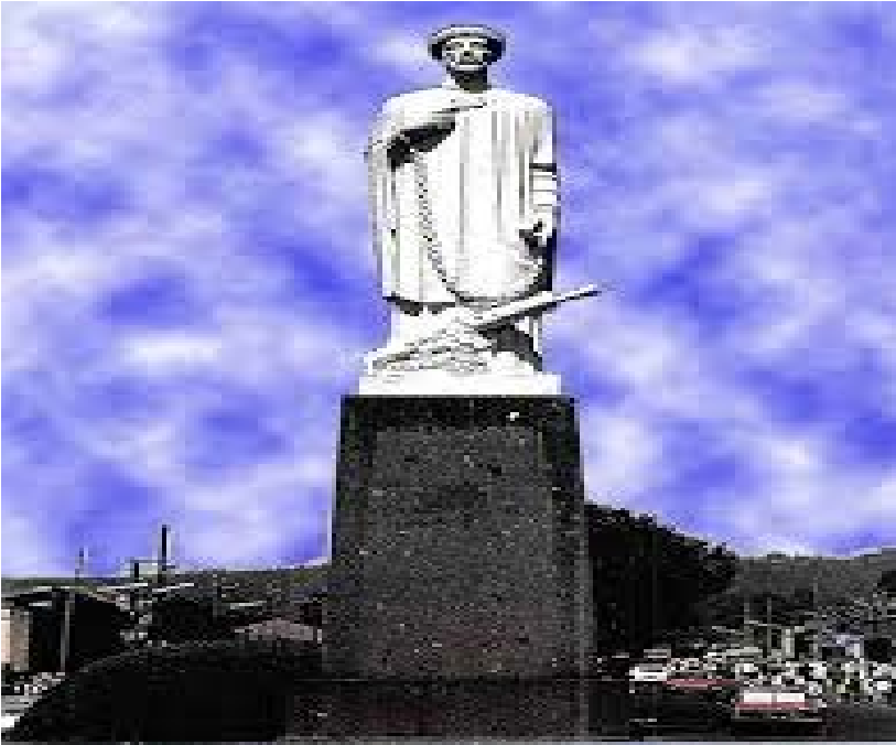
የአቡነ ጴጥሮስ ኃውልት