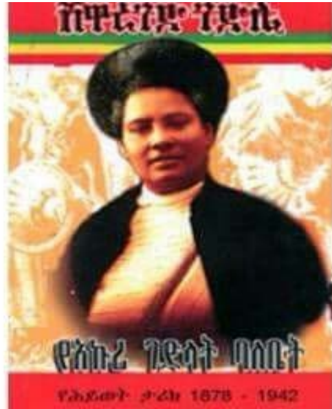
የሴት አርበኛ ወ/ሸዋረገድ ገድሌ