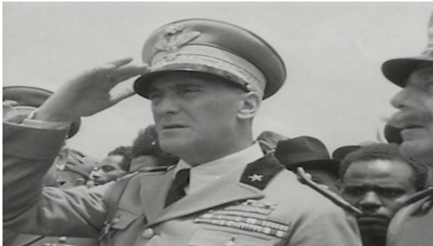
“የኢትዮጵያ ጨፍጫፊው” ሮዶልፎ ግራዚያኒ

ከከፍተኛ ቦታና ከአውሮፕላን በመወርወር፤ በጩቤ፤ በዶማ፤ በዘረኛነት በማግለል፤ ወዘተ ተጠቅመዋል።