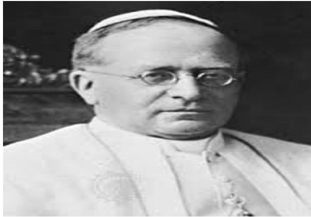
የሻቲካኑ ፖፕ ፓየስ 11ኛ