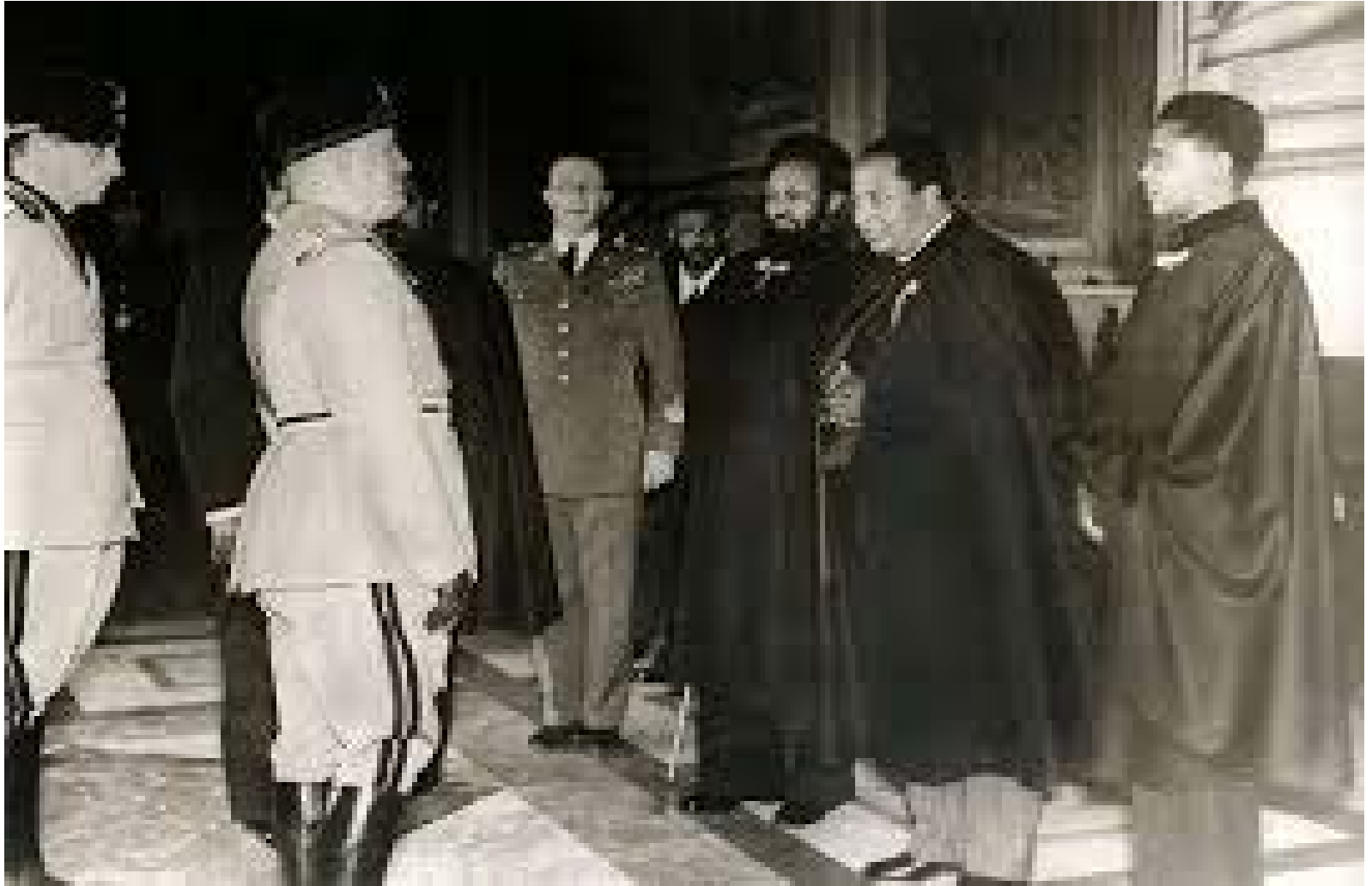
ራስ ኔታቸው ከመሰሊኑ ጋር