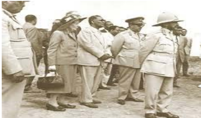
ሲልቪያ ፓንከርስት ከጃንሆይ ጋር