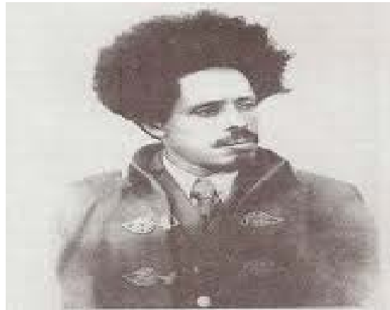
ԵՆ ԿՈՈ ԿԼՉՔ