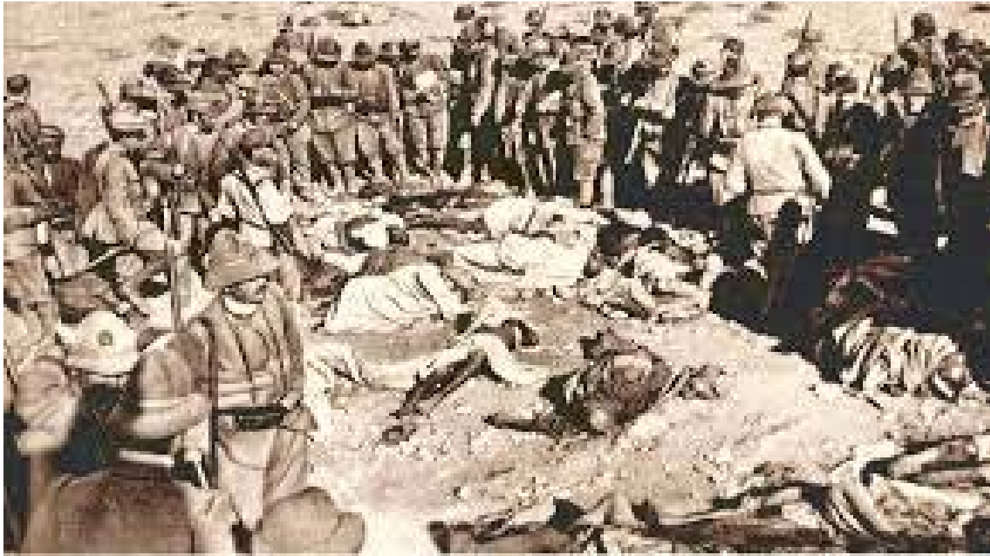
ፋሺስቶች በመርዝ ጋዝ የተጨፈጨፉትን የኢትዮጵያውያን ራሳዎች ሲመለከቱ