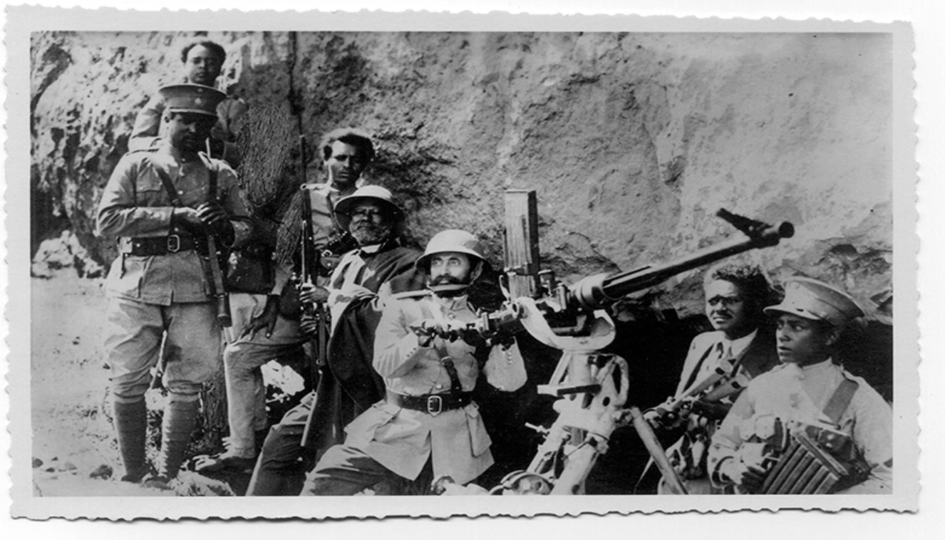
ቀዳማዊ ኃይለ ሥላሴ በጦርነቱ ላይ